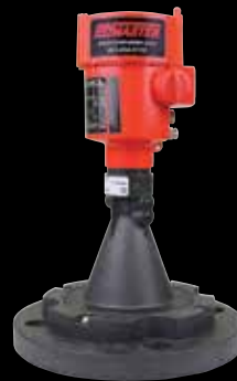
Opción de Antena de Plástico Liviano