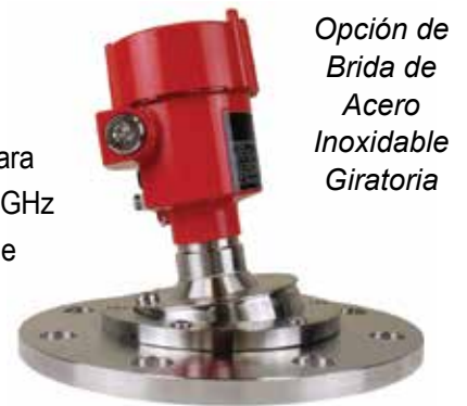
Opción de Brida de Acero Inoxidable Giratoria

El BinMaster NCR-80 es un sensor de nivel de radar sin contacto diseñado específicamente para rendimiento en polvos y sólidos a granel. Su avanzada tecnología utiliza una frecuencia de 80 GHz enfocado en un estrecho ángulo de haz de 4°. Esto asegura un rendimiento fiable en rangos de medición de hasta 393 pies y la precisión dentro de 0,2 pulgadas. El NCR-80 es ideal para el nivel continuo medición en recipientes altos y estrechos donde hay ruido o polvo excesivo.