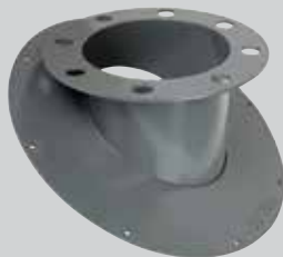
Placa de Montaje 30°

No todos los techos son planos. Así, además de la placa accesible de montaje 0°, BinMaster ofrece una placa de montaje de 30° con una brida ANSI de 4". Este ángulo del techo es especialmente prominente en la industria del grano, donde el radar sin contacto de 80 GHz penetrante de polvo se está convirtiendo en un sensor cada vez más popular. O bien, hay el soporte giratorio de 10° para la versión con revestimiento de metal de la NCR-80 que viene en tamaños de brida de 4", 6" o 8" 316L que permite un objetivo preciso a la salida de la embarcación. Para la versión de antena de cuerno de plástico NCR-80, la orientación direccional de 8° está disponible con bridas adaptadoras de 3", 4" o 8". ¿Qué hay de bueno en todas estas opciones? No se necesita ninguna fabricación en el lugar y es probable que pueda utilizar una brida de techo existente. Esto simplificará la instalación, ahorrándole tiempo y dinero.