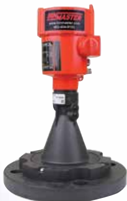
NCR-80 Modelo de trompeta plástica