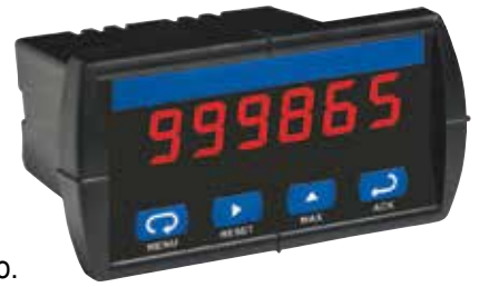
Pantalla Local de Información

Basado en el número y la ubicación de sus silos y donde es más fácil acceder a los datos, BinMaster diseñará una solución que se adapte a sus necesidades y se ajuste a su presupuesto.