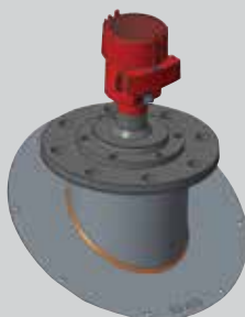
Placa de Montaje 30° con modelo NCR-80 de cubierta de metal