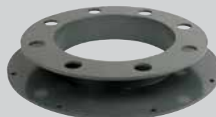
Placa de Montaje 0°