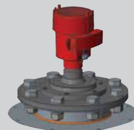
Placa de Montaje 0° con modelo NCR-80 de cubierta de metal