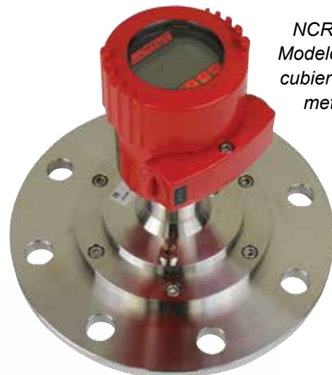
NCR-80 Modelo con cubierta de metal

Usted tiene muchas opciones cuando se trata de un radar sin contacto. Lo que no puede obtener de otros fabricantes son las opciones y accesorios que hacen que su instalación sea más simple y más accesible. Además, BinMaster proporciona la solución completa desde el sensor hasta las opciones de salida de datos.