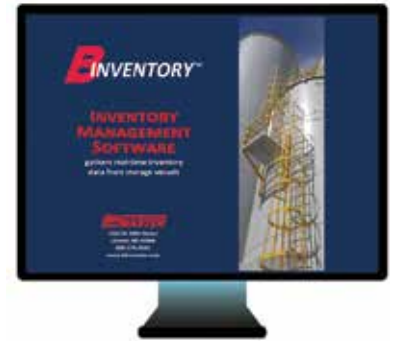
BinInventory™ PC software

Usted compra sensores porque necesita datos para administrar su inventario. Con BinMaster, tiene más opciones sobre dónde van los datos. El NCR-80 no requiere un PLC o consola. Claro, puedes usarlos si lo prefieres, pero BinMaster te da otras opciones. El software BinInventory™ de BinMaster se instala en una PC de su LAN, WAN o VPN. Este software (antes conocido como eBob) recopila datos de más de 50 recipientes y envía alertas automáticas de alto y bajo nivel, visualiza los niveles de recipientes y genera informes de uso. Puede ser utilizado por un usuario o instalado en toda su organización.