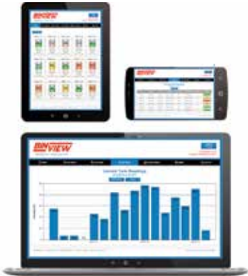
BinView manejo de inventario en tu teléfono, tableta, o PC.

La avanzada plataforma de software no sólo es compatible con el NCR-80, sino también con una amplia variedad de sensores de nivel continuo BinMaster o casi cualquier sensor que utilice el protocolo Modbus RTU. Esto hace que BinInventory™ sea una solución completa para gestionar el inventario de sólidos o líquidos contenidos en contenedores, tanques o silos.