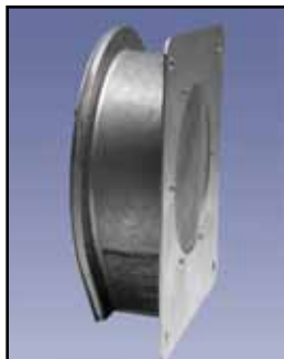
BM-45 Interruptor de Diafragma