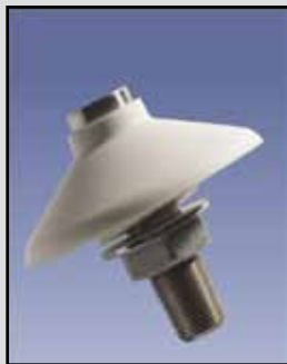
Airbrator Aireación y Vibración

Voltaje de Entrada: 115 VAC ± 10%, 50/60 Hz, 3 VA. 230 VAC ± 10%, 50/60 Hz, 3 VA. 24-48 VCC, 2 W máximo Relé: SPDT, 2 amperios 240 VAC Caja o Cobertura: NEMA 4X Temperatura de Funcionamiento: -4°F a 158°F (-20°C a +70°C) Garantía: Un año