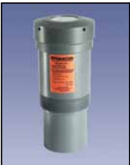
SmartSonic Transmisor Ultrasónico

Requisitos de Energía: 115/230 VAC 50/60 Hz Temperatura Ambiente: -20°F a 140°F (-29°C a + 60°C) Proceso Temperatura: Hasta 140°F (60°C) Rango de Medición: 40 pies Frecuencia de Mediciones: 1 pie por segundo Precisión: ± 0.25% desvincúlese certeza demedida Montaje: Especial sobre el perno o 3" - 6" NPT Caja/Cobertura: Rotacional de polietileno moldeado Aprobaciones y Certificaciones: NEMA 4X (IP65)