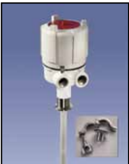
PROCAP I & II 3-A Sensor de Capacidad

PROCAP IX Requisitos de Energía: Fuente universal de alimentación 24 a 240 VAC / VDC PROCAP IIX Requisitos de Energía: Seleccionable 115/230 VAC Salida de Relé: DPDT de 10 amperios a 250 VAC Temperatura Ambiente: -40°F a 185°F (-40°C a +85°C) Proceso de Temperatura: A 250°F sonda Delrin (121°C); a 500°F sonda de Teflón (260°C) Presión: 500 PSI Aprobaciones y Certificaciones: En la lista de las Categorías I, Grupos C, D y Clase II, Grupos E, F y G para lugares peligrosos Tipo de Caja o Cobertura: NEMA 4X, 5, 7, 9 y 12 Caja de Protección: Aluminio fundido, USDA aprobado acabado en polvo Montaje: 1-1/4" NPT o 3 / 4" NPT 316 SS estándar; 1-1/4" NPT 316 SS y reborde sanitario opcional