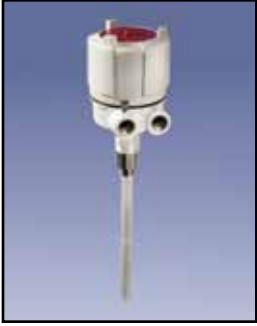
PROCAP I & II Sensor de Capacidad