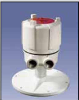
PROCAP I & II Sensor de Capacidad

PROCAP I 3-A Requisitos de Energía: Fuente universal de alimentación 24 a 240 VAC/VDC PROCAP II 3-A Requisitos de Energía: 115/230 VAC seleccionable Salida de Relé: DPDT de 10 amperios a 250 VAC Temperatura Ambiente: -40°F a 185°F (-40°C a +85°C) Proceso de Temperatura: A 250°F sonda Delrin (121°C); a 500°F sonda de Teflón (260°C) Presión: 500 PSI Aprobaciones y Certificaciones: En la lista de Clase II, Grupos E, F y G para lugares peligrosos Tipo de Caja o Cobertura: NEMA 4X, 5, 9 y 12 Caja de Protección: Aluminio fundido, USDA aprobado acabado en polvo Montaje: 1" o 2,5" reborde sanitario