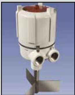
MAXIMA+ Indicador Rotativo

Requisitos de Energía: 24/115/230 VAC, 50/60 Hz, 24/12 mA VCC, 60/35 Contactos de Salida: DPDT de 10 amperios, 250 VAC Temperatura Ambiente de Funcionamiento: -40°F a +185°F (-40°C a +85°C) Proceso de Temperatura: Hasta +400°F (204°C) Presión: 1/2 micrones, 30 PSI Aprobaciones y Certificaciones: CSA/US Clase I, Grupos C y D y Clase II, Grupos E, F y G Ex II 2G 1D Ex d IIB T5 Ex tD A20 IP66 T93C (Ta = -20C to +85C) Tipo de Cobertura/Caja: NEMA 4X, 5, 7, 9 y 12 Caja: Aluminio fundido, aprobada por el USDA en acabado en polvo capa Montaje: 1-1/4 "NPT Conexiones de los Conductos: 3/4 "NPT Eje y Componentes: Acero inoxidable