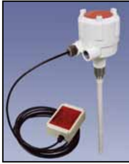
PRO REMOTE Sensor de Capacidad