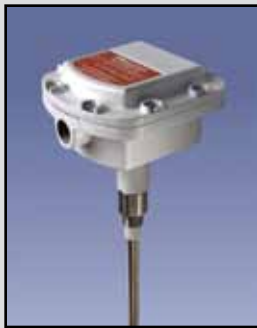
PRO AUTO CAL Sensor de Capacidad

Requisitos de Energía : 115/230 VAC, 50/60 Hz \pm 15%, 5 VA Salida de Relé: DPDT de 10 amperios a 250 VAC Temperatura Ambiente: -40°F a 185°F (-40°C a +85°C) Proceso de Temperatura: A 250°F sonda Delrin (121°C); a 500°F sonda de Teflón (260°C) Presión: 500 PSI Aprobaciones y Certificaciones: En la lista de CSA, Intrínsecamente Seguro, NEMA 4X, 5 y 12 Sonda de Caja/Cobertura: Aluminio fundido, aprobada por el USDA en acabado en polvo Cobertura Electrónica: Policarbonato o de aluminio Montaje: 1-1/4" NPT o 3/4" NPT en acero inoxidable 316 Estándar: 1-1/4" NPT en acero inoxidable 316 y reborde sanitario opcional