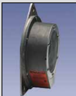
BM-65 Interruptor de Diafragma

Clasificaciones del Interruptor: 15 Amps a 125, 250 o 480 VAC, 1/8 HP @ 125 VAC, 1/4 HP @ 250 VAC, 1/2 amperios @ 125 VDC, 1/4 amperios @ 250 VDC Temperatura de Funcionamiento: -40°F a 300°F (-40°C a +149°C) Caja o Cobertura de Protección: Aluminio fundido Montaje: Interna o externa, de calibre 16 placa galvanizada de montaje