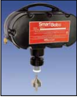
SmartBob2 Sensor Cable-Basado