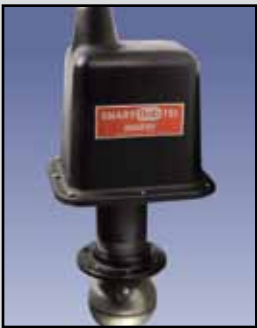
SmartBob - TS1 Sensor Cable-Basado

Requisitos de Energía: 115/230 VAC 50/60 Hz Temperatura Ambiente: -40°F a 185°F (-40°C a +85°C) Proceso de Temperatura: Hasta 500°F (260°C) Rango de Medición: Hasta 180 pies Velocidad de Medición: 2 metros por segundo Precisión: ± 0.25% desvincúlese certeza demedida Montaje: 3" - 8" NPT Caja/Cobertura: Molde de policarbonato Aprobaciones y Certificaciones: En la lista de Clase II, Grupos E, F y G para lugares peligrosos Tipo de Caja: NEMA 4X, 5, 9 y 12