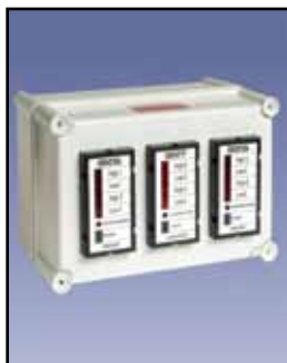
Panel de Alarma para Nivel de Puntos

Clasificaciones del Interruptor: 15 Amps a 125 o 250, 1/8 HP @ 125 VAC, 1/4 HP @ 250 VAC, Amp 1/2 @ 125 VDC, 1/4 amperios @ 250 VDC Temperatura de Funcionamiento: -40°F a 300°F (-40°C a +149°C) Aprobaciones y Certificaciones: En la lista de Clase II, Los Grupos E, F y G para lugares peligrosos Tipo de Caja o Cobertura: NEMA 4, 5, 9 y 12 Caja de Protección: Aluminio fundido Montaje: Interna o externa, de calibre 16 placa galvanizada de montaje