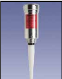
SmartWave Transmisor de Radar de Pulso

Requisitos de Energía: Las unidades de CA (corriente alterna) de 115 VAC 60 Hz o 230 VAC 50 Hz, unidades de DC 12 a 30 VDC 0.07 Amperios Temperatura Ambiente: -40°F a 140°F (-40°C a + 60°C) Proceso de Temperatura: Hasta 200° F (93°C) Operación: Ultrasonidos Frecuencia: 25 a 148 KHz Rango de Medición de Líquidos: 90' máxima Gama de la Medida de Sólidos: 40' máxima Precisión: ± 0.25% Ángulo de Haz: 6° - 12° cónica a-3dB Compensación de Temperatura: Continua en transductor Salida: 4-20 mA y RS-485 Montaje: 3" NPT Caja/Cobertura: PVC-94VO Aprobaciones y Certificaciones: NEMA 4X (IP65)